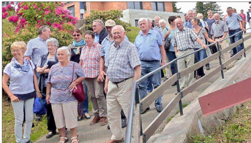
ALTERSMANNSCHAFT: Einen interessanten Tag erlebten die Ausflügler aus Egringen im Elsass.

Bei herrlichem Wetter führte die Fahrt weiter durch blühende Wiesen über den Grand Ballon zu einer Ferme in Schnepfenried zum Mittagessen. Durchs Münsental ging es dann nach Vögtlinshoffen, wo die Gruppe die Kellerei eines großen Weingutes besuchte und eine Weinprobe mit Gugelhupf genoss. Sehr beeindruckend, darin waren sich alle einig, war die überwältigende Aussicht über die Rheinebene bis zum Schwarzwald vom Balkon des Weingutes aus.